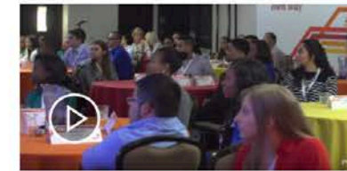
PwC's Start Masters Program