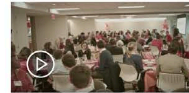
Explore - PwC's Career Discovery Program