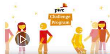
PwC's Challenge Case Competition