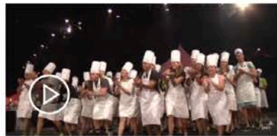
Launch your career with PwC!