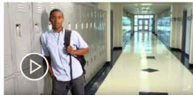
We are PwC