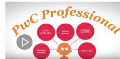
The PwC Professional