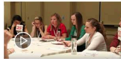
PwC's Elevate Program